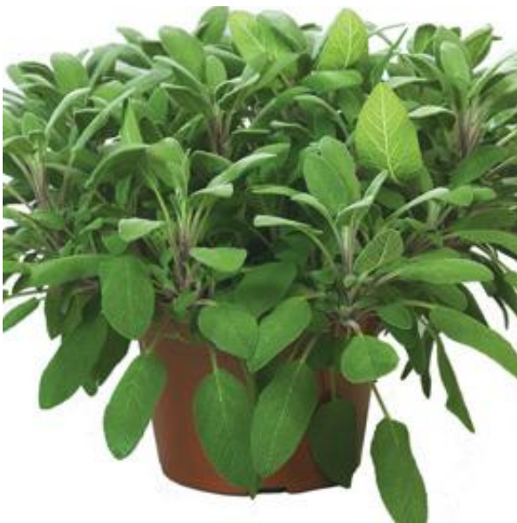
SALVIA OFFICINALIS GROWER FRIEND - KADULJA

ŽAČINSKO BILJE – DODATAK HRANI ZA MESO, RIBU, PIZZU, UMAK, JUHE, POMAŽE KOD ŽELUČANIH TEGOBA I GLAVOBOLJE