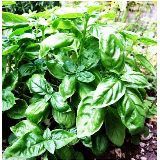
OCIMUM BASILICUM SWEET - BOSILJAK

ŽAČINSKO BILJE – DODATAK HRANI ZA MESO, RIBU, PIZZU, UMAK, JUHE, POMAŽE KOD ŽELUČANIH TEGOBA I GLAVOBOLJE