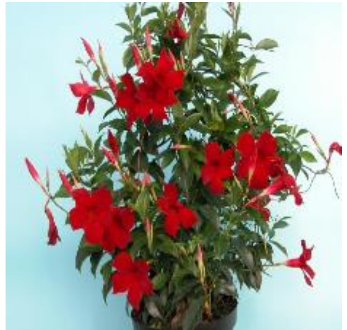
Dipladenija sunde vile