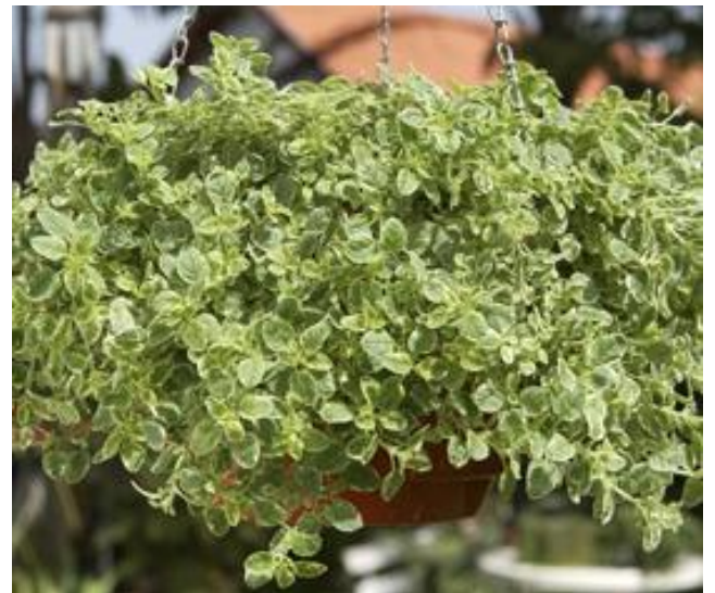
ORIGANUM VULGARE AUREUM VARIGATA - ORIGANO

ŽAČINSKO BILJE – DODATAK HRANI ZA MESO, RIBU, PIZZU, UMAK, JUHE, ČAJ, POMAŽE KOD ŽELUČANIH TEGOBA