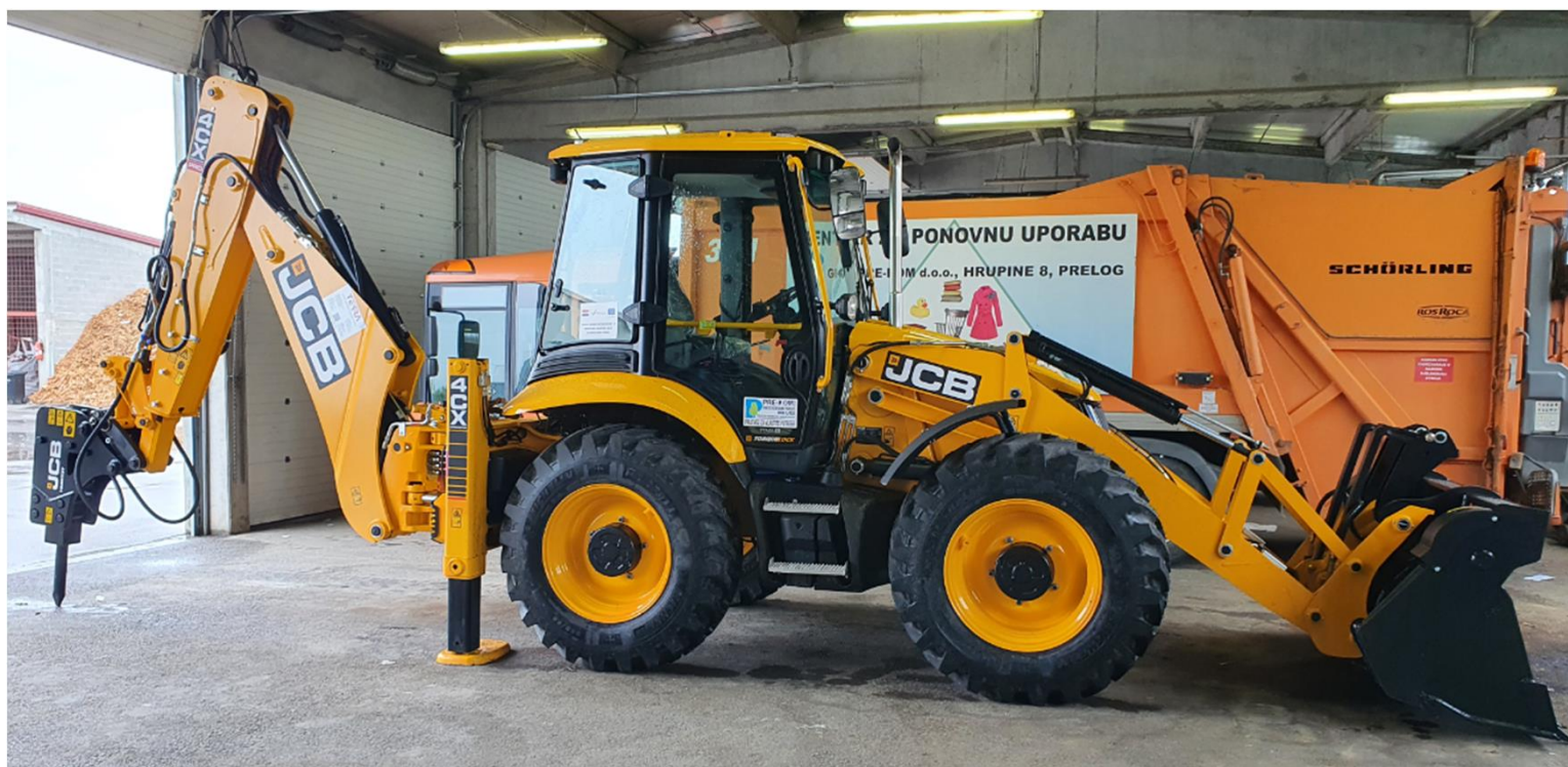
Rovokopač sa udarnim čekićem