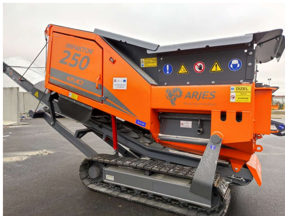
Drobilica građevinskog otpada