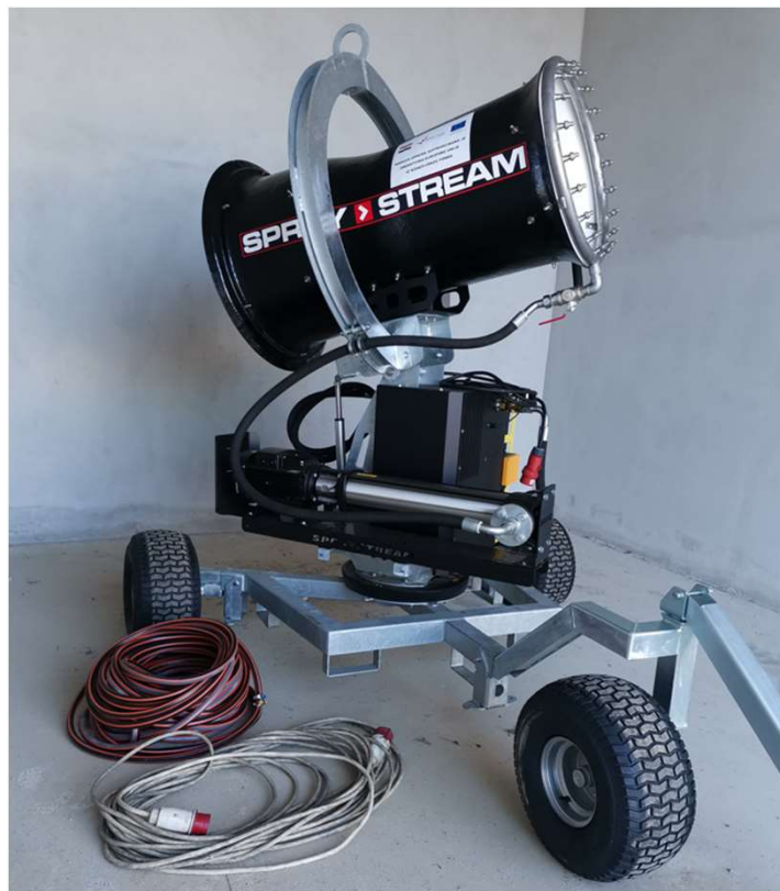
Zamagljivač vodenom maglom