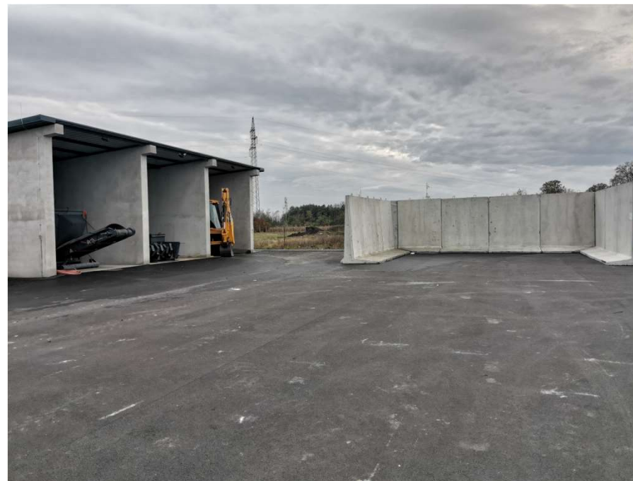
Reciklažno dvorište za građevinski otpad Prelog